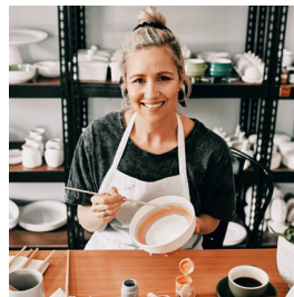
ACTIVIDADES CON INGRESOS ADICIONALES