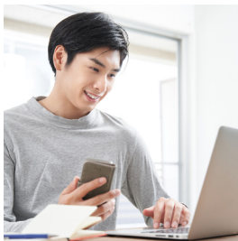
TRABAJO A DISTANCIA

E l mundo ha cambiado de manera asombrosa, y con él, nuestra forma de concebir el trabajo. Hoy las personas buscan nuevas formas de ganarse la vida, de sentirse libres, de organizar su tiempo, y encontrar un camino que no solo cubra sus necesidades, sino que sea gratificante y permita cuidar de sus familias. Buscan un trabajo con propósito, que aporte valor a los demás y que ofrezca la posibilidad de autorrealización. Por eso, han cobrado impulso tendencias como las siguientes: