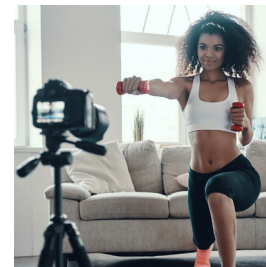
NEGOCIOS DE ESTILO DE VIDA