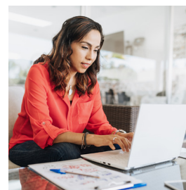
NEGOCIOS DESDE CASA

Si eres una de esas personas que buscan un negocio con un estilo de vida diferente, Immunotec es la solución ideal. Es la oportunidad perfecta para trabajar desde casa, ya sea porque simplemente busques un “ingreso adicional” o desarrollar una nueva profesión. Y una de las mayores ventajas de convertirse en Consultor de Immunotec es la oportunidad de descubrir el poder del apalancamiento.